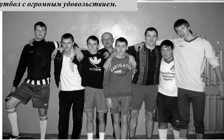
Материалы подготовила Т. ТУЗОВА.